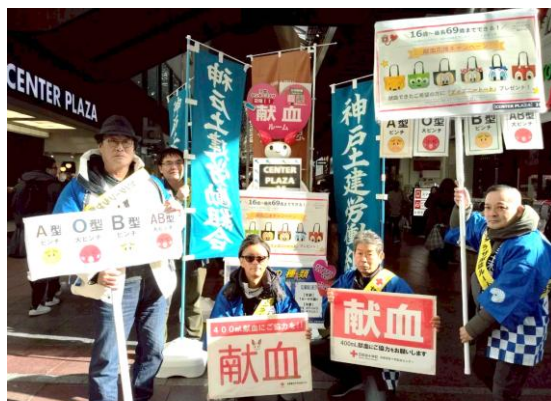
「献血で救われる命があります」 社保対部で12月14日、三宮センタープラザで通行人に献血の協力を呼びかけしました